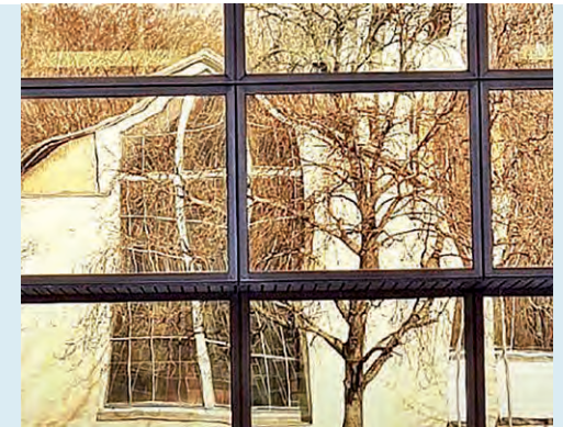
Spiegelung im Nixdorf-Bau

In den Sechzigern begann die Flächensanierung, die den Stadtteil über viele Jahre prägte und einen umfangreichen Bevölkerungsaustausch zur Folge hatte. Dann der Niedergang der AEG – als 1984 die letzte der vier Fabriken geschlossen wurde, folgte alsbald der Rückbau der städtischen Infrastruktur (heute können es manche gar nicht glauben, dass es damals Kaufhäuser, eine Post oder eine Poli-