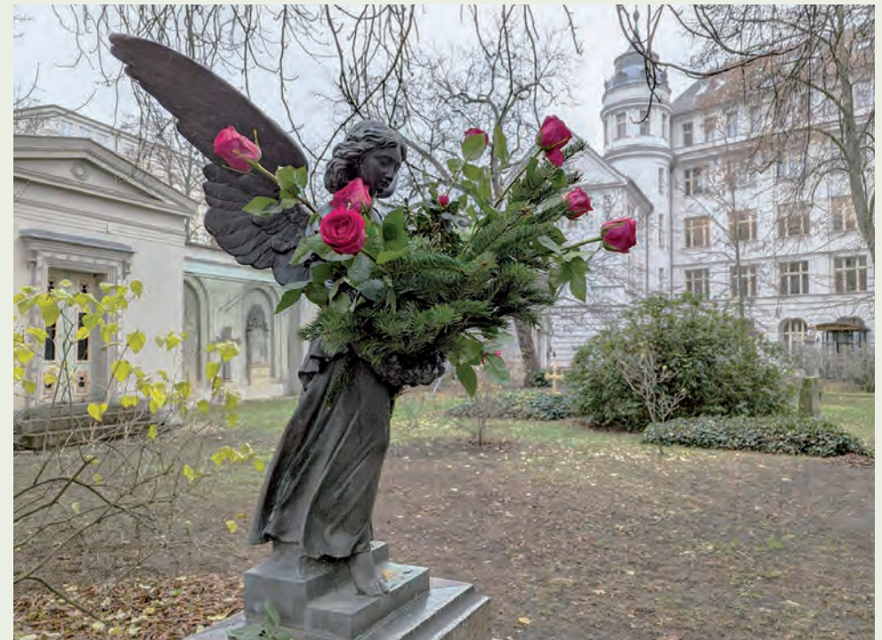
Parochialkirchhof an der Georgen-Parochialkirche

Die Veröffentlichungen in der Rubrik Freud & Leid erfolgen gemäß § 50b DSGVO-EKD. Für mögliche zukünftige Veröffentlichungen ist ein Widerspruch unter gemeindebuero@gesundbrunnen-evangelisch.de oder schriftlich an die Herausgeberadresse möglich.