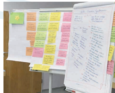
Zu Papier gebrachte Ergebnisse und Bodenbild mit Wünschen und Visionen