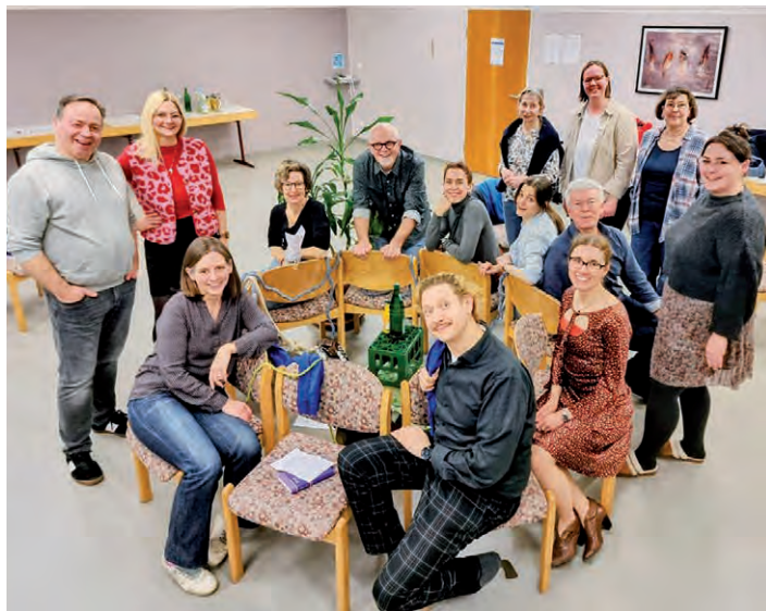
Ein improvisierter Brunnen, der Gemeinschaft stiftet: Die Ältesten des Gemeindegemeinderates trafen sich Mitte März zu ihrer ersten Wochenend-Rüstzeit.

Ausgehend vom Namen unserer jungen „Kirchengemeinde am Gesundbrunnen“ sprachen wir über biblische Worte, in denen Brunnen und Quellen vorkommen. Mit persönlichen Assoziationen gingen wir auf Spurensuche danach, was auch spirituell ein Brunnen bedeuten kann, und was für Qualitäten er hat: Mit der Unverfügbarkeit seines im Untergrund fließenden Wassers. Der tiefe Quell. Die Mühe von Menschen, Wasser heraufzuholen und weiterzugeben. Auch die Unheimlichkeit wurde erwähnt, dass etwas in den Brunnen fallen oder geworfen werden kann. Was dann verschwunden ist, für ewig.