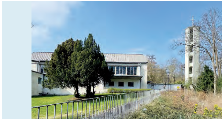
Die Himmelfahrtkirche von außen