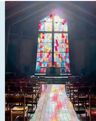
Der Kirchraum mit Buntglasfenster

Die ersten Jahre standen noch im Zeichen der mit unzähligen Geschäften belebten Brunnen-