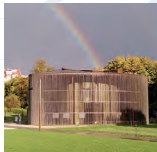
Kapelle der Versöhnung