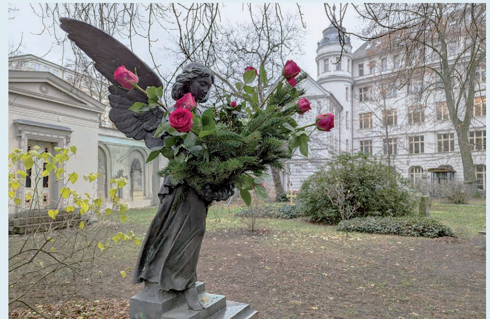
Parochialkirchhof an der Georgen-Parochialkirche

Die Veröffentlichungen in der Rubrik Freud & Leid erfolgen gemäß § 50b DSGVO. Für mögliche zukünftige Veröffentlichungen ist ein Widerspruch unter gemeindefuero@gesundbrunnen-evangelisch.de oder schriftlich an die Herausgeberadresse möglich.