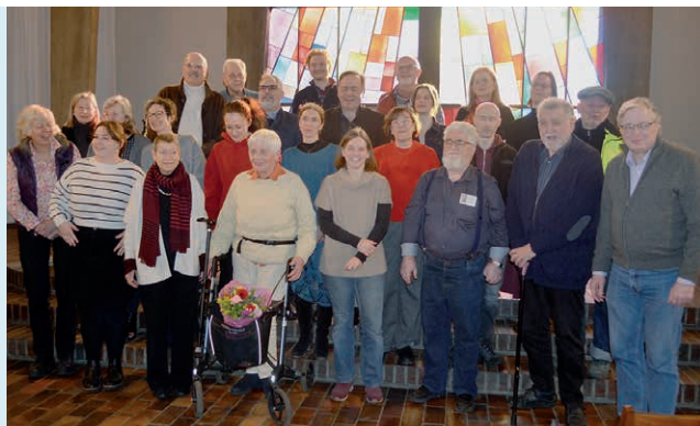
Großes GKR-Gruppenfoto nach dem Gottesdienst am 11. Januar