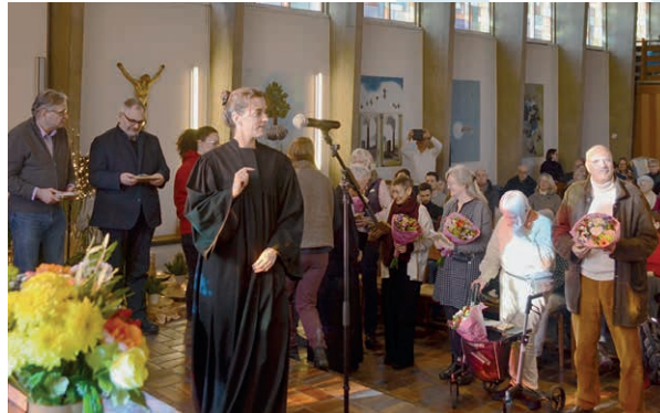
Verabschiedung im Gottesdienst am 11. Januar

Die Verabschiedung der bisherigen Kirchenältesten des Übergangs-Gemeindekirchenrates hat am Sonntag, den 11. Januar, in der Himmelfahrtkirche stattgefunden. Genau vor einem Jahr, Anfang Januar 2025, hatte sich aus den drei benachbarten Kirchengemeinden an der Panke, am Humboldthain und Versöhnung das Gremium aus 26 Ältesten zusammengesetzt, um bis zur GKR-Wahl das erste Jahr der