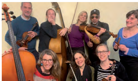
Los Tamalitos