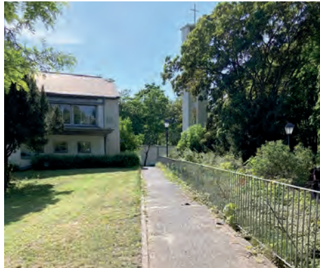
Der Außenbereich um die Himmelfahrtkirche