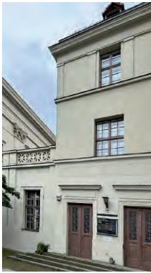
Das Gemeindehaus in der Badstraße 50

Wie bereits berichtet, wollen wir einige Dinge entrümpeln, bevor der Umbau der Küsterei in St. Paul beginnen kann. Das heißt: viele Sachen müssen auf den Hof getragen werden. Schränke umgesetzt und wieder eingeräumt werden. Dafür brauchen wir starke Arme und gesunde Rücken. Wer Zeit und Kraft hat, ist herzlich willkommen. Wir würden uns über Ihren Einsatz sehr freuen!