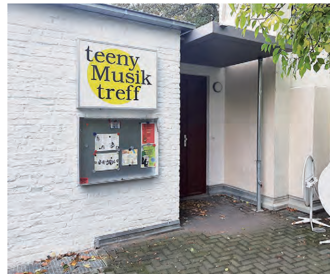
Der Eingang zum teeny Musik treff

Zu diesem Thema werden wir demnächst im Gemeindebrief informieren.