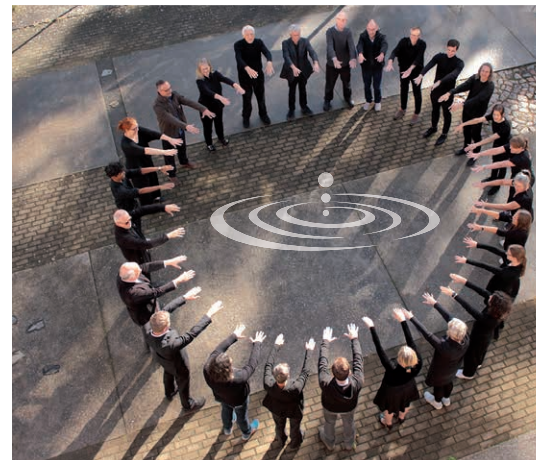
Chorfahrt 2024

Am 7. Januar haben die Proben im neuen Jahr mit der Missa „Princeps pacis“ von William Lloyd Webber (1914-1982) begonnen. William Lloyd Webber war der Vater des berühmten Musical-Komponisten Andrew Lloyd Webber. Er komponierte Vokal-, Orchester- und andere Instrumentalwerke und war als Kirchen-