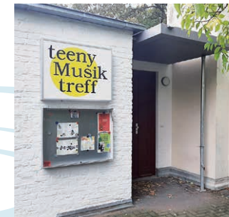
teeny Musik treff

Gustav-Meyer-Allee 2, 13355 Berlin (Eingang am Glockenturm) Tel. 030/747 318 23, Fax: 030/464 049 09 kontakt@teeny-musik-treff.de www.teeny-musik-treff.de