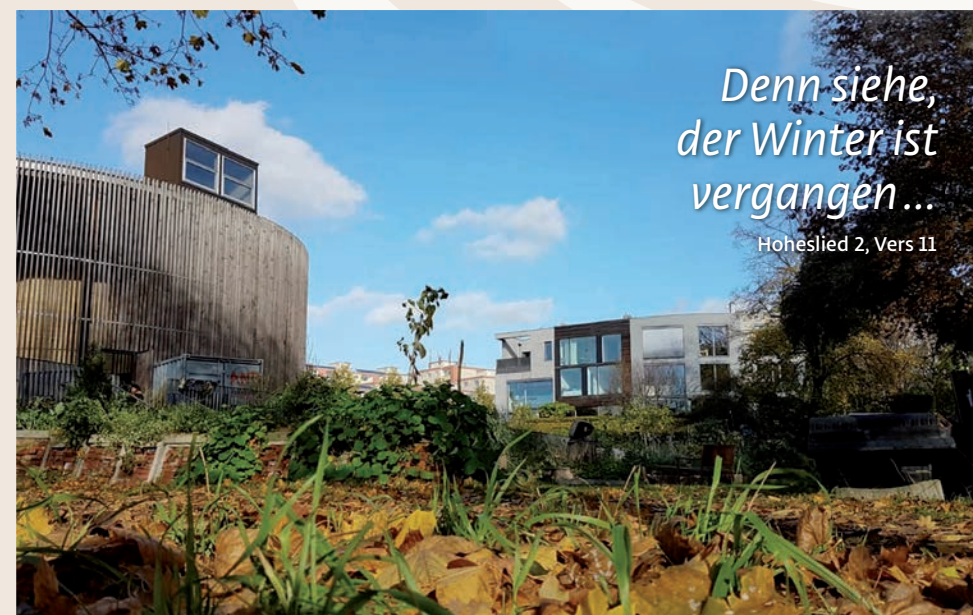
Gemeinschaftsgarten Niemand'sLand im Vorfrühling

Die Veröffentlichungen in der Rubrik Freud & Leid erfolgen gemäß § 50b DSGVO. Für mögliche zukünftige Veröffentlichungen ist ein Widerspruch unter gemeindebuero@gesundbrunnen-evangelisch.de oder schriftlich an die Herausgeberadresse möglich.