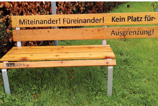
Bank vor dem Bibelzentrum in Barth

Unsere Landeskirche sagt: „Ehrenamtliche zeigen in der Gesellschaft, was unsere Kirche alles kann. Sie sind durch die kirchlichen Angebote mit den Menschen und Einrichtungen im Stadtteil im Kontakt“.