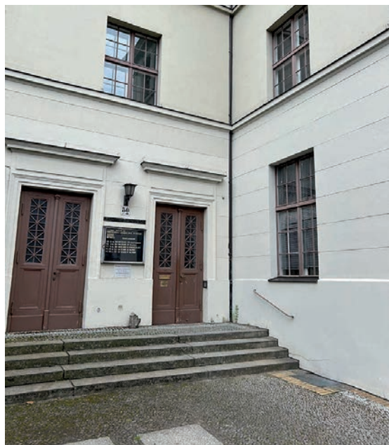
Dieser Zugang zum Gemeindebüro in der Badstraße 50 wird voraussichtlich durch die Bauarbeiten blockiert werden.

In diesem Jahr sind am Standort St. Paul Sanierungsarbeiten geplant. Im Keller unter der Küsterei korrodiert (rostet) ein Stahlträger. Daher muss der Keller abgedichtet werden.