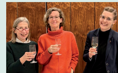
Auf eine gute Zusammenarbeit. Impressionen vom Start der Sitzung des neuen GKR am Gesundbrunnen