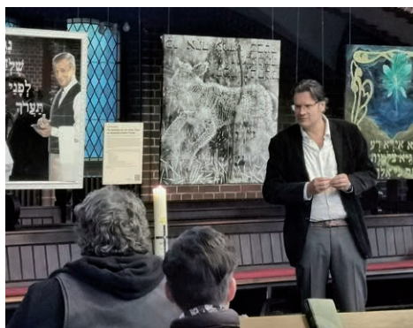
Andacht zur Psalm-23-Ausstellung

Dabei stellt sich heraus – ganz überraschend – dass Kirche und Kiez viele Werte teilen: Solidarität und Einsatz für die Armen; Nächstenliebe und Großherzigkeit; treue Freundschaft