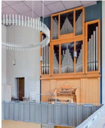
die Beckerath-Organ in St. Paul

Es ist soweit: Im Jahr 2025 soll es wieder heißen „Orgel satt“ – 30 Minuten Orgelmusik und anschließendes Beisammensein bei Speis und Trank.